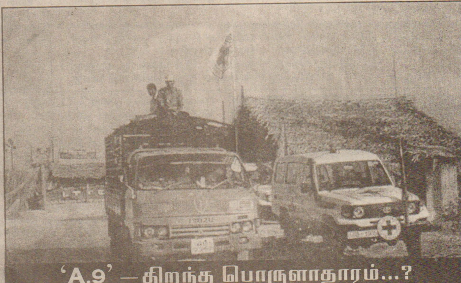
'A.9' - திறந்த பொருளாதாரம்...?

இதன்மூலம், சமூக நலன் என்பது பாதுகாக்கப்பட வழி ஏற்படுகின்றது. அத்துடன், குறித்த சமூகமும் தன்னை வளர்த்துக்கொள்ளவும், வாழ்க்கைத் தரத்தினை உயர்ந்த நிலையில் பேணிக்கொள்ளவும் முடியும். ஒட்டு மொத்தத்தில் மக்களே இப்பிரச்சினையை வெற்றிகொள்ள வலுமிக்க சக்திகளாக இங்கு இருக்கின்றனர் என்றால் அது ஒன்றும் மிகையல்ல.