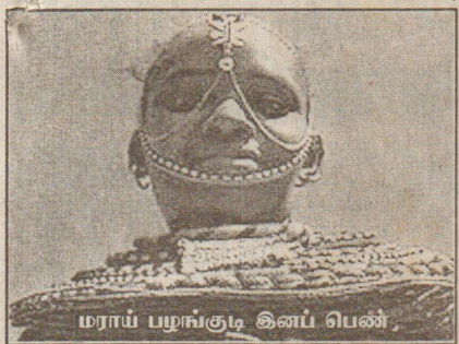
மராய் பழங்குடி இனப் பெண்

பிரிட்டிஷ் படையினர் தம்மைப் பாலியல் வல்லுறவுக்கு உள் ளாக்கியதாக, நூற்றுக்கணக்கான கென்யப் பெண்கள் முறைப்பாடு செய்துள்ளதையடுத்து - அவர்களுக்கான சட்ட உதவிகளை வழங்கப் பிரிட்டன் முன்வந்துள்ளது.