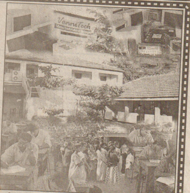
அறிவு என்பவற்றைப் பரீட்சிப்பதாக அமைந்திருக்கும். இவ்வினாப்பத்திரம் 60 நிமிடங்கள் கொண்டதாக அமையும். இங்கு தரப்படும் வினாக்கள் அனைத்தும் பரீட்சார்த்தியால் விடையளிக்கப்பட வேண்டியவை. இவ்வினாத்தாள் மாத்திரம் தமிழ்மொழியில் அமைந்திருப்பதோடு, விருப்பத் தேர்வு (MCQ) முறையையும் பின்பற்றியுள்ளதால் மாணவர்கள் மூன்றில் ஒரு விடையினைத் தெரிவுசெய்யலாம். இவ்வினாத்தாள் சுமார் எட்டுப் பக்கங்களைக் கொண்டதாக அமைந்திருக்கும்.