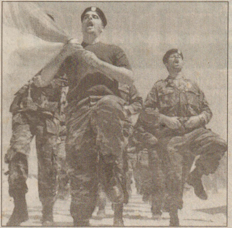
மேற்குக்கரை நகரான பெத்தலகேமிலிருந்து, இஸ்ரேலியப் படைகள் வெளியேறுவதைத் தொடர்ந்து - அந்நகரின் பாதுகாப்பைப் பொறுப்பேற்கத் தயாராகும் பலஸ்தீனிய விசேட படையினர்.

இப்பகுதியில் நேற்று அதிகாலை புல்தேசர்கள் சகிதம் நுழைந்த இஸ்ரேலியப் படைகள் - அத்திவாரப் பகுதியைக் கிளறி எறிந்தனர். இந்நடவடிக்கைக்கு எதிர்ப்புத் தெரிவித்து ஆர்ப்பாட்டம் நடத்திய பல பலஸ்தீனர்கள் கைதாகியுள்ளனர்.